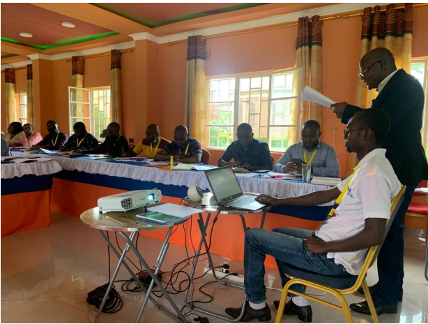
Schulung für christlichen Leiter