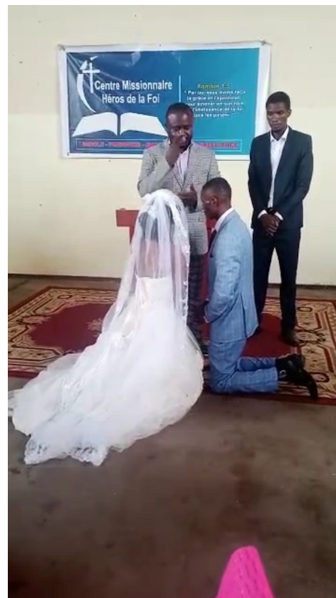
Hochzeit von gehörlosen Paar