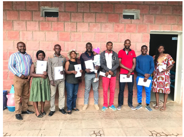
Teilnehmer der Ausbildung